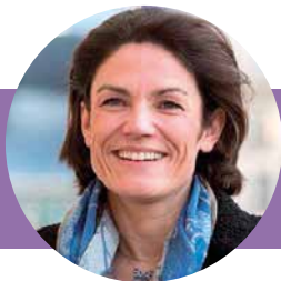
Chantal Jouanno est ancienne Sénatrice et ancienne Secrétaire d'État chargée de l'Écologie (2009) et des négociations du Grenelle de l'Environnement.

L'insoutenabilité environnementale et sociale de notre modèle de développement n'est pas une fatalité. Il n'est que l'expression d'une société dominée par ses inégalités sociales et plus encore sexuées. Le refus de reconnaître aux femmes la libre disposition de leur corps n'est que la conséquence d'une société patriarcale. •