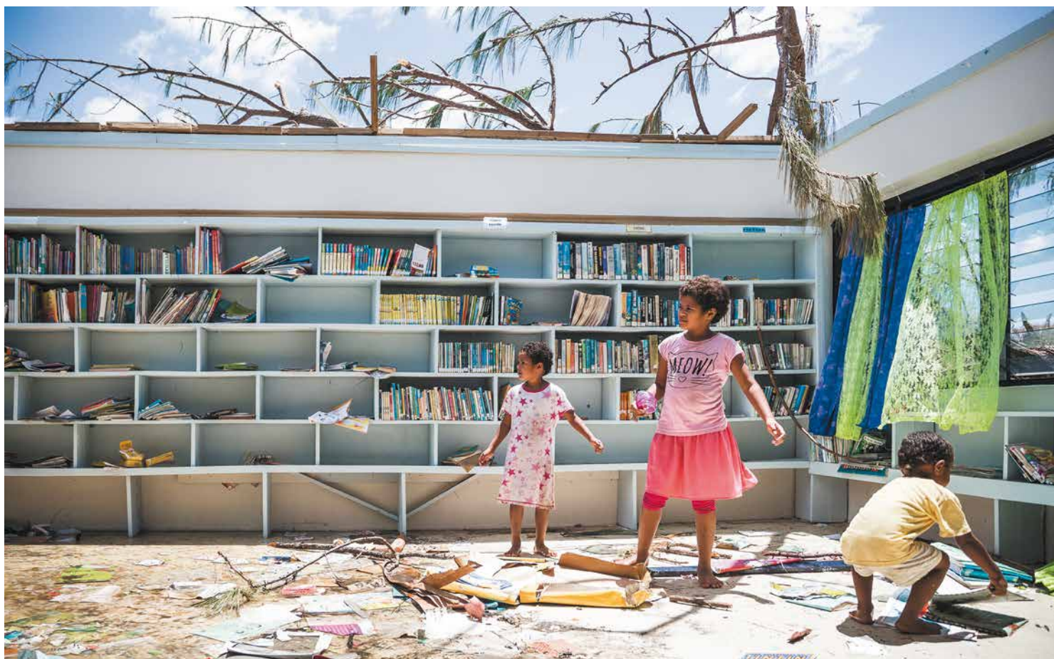
Fiji, 2016. Le 29 février 2016. Des enfants jouent dans la bibliothèque d'une école endommagée par le cyclone Winston à Nabau.

Le Livre Blanc est disponible sur : www.climat-sante.org