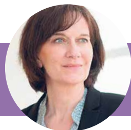
Laurence Rossignol est Sénatrice et ancienne Ministre des Familles, de l'Enfance et des Droits des femmes.

Promouvoir l'égalité entre les femmes et les hommes, ce n'est pas seulement défendre un principe éthique et politique, c'est aussi défendre un projet de société viable, durable et inclusif. •