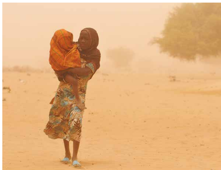
Tchad, 2010. Une fille porte son bébé dans un nuage de poussière dans le village de Sidi, dans la région du Kanem.

La COP 22 met en lumière dans une urgence absolue cet enjeu. Comment rester inertes et dans la seule position de témoins? •