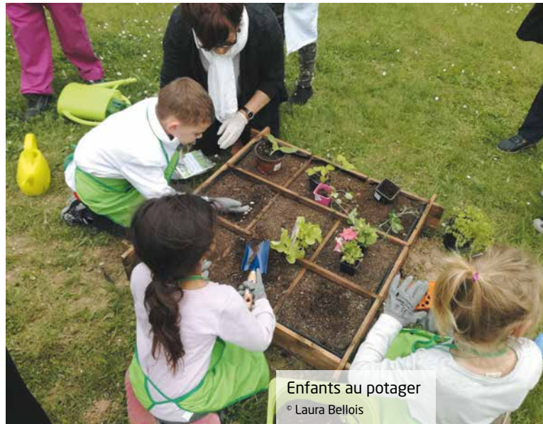
Enfants au potager

Avec l'installation d'un poulailler, nous avons poursuivi les initiatives lancées par le chef de cuisine Cédric Guibert sur la gestion des déchets alimentaires. Depuis plusieurs années, il lutte contre le gaspillage et encourage le tri sélectif. Nous avons également mis en place une collecte de bouchons de bouteilles au profit de l'association Les bouchons de l'espoir , qui finance des fauteuils handi-bike pour rendre le sport accessible à tou-te-s. Grâce à cette initiative, nous travaillons